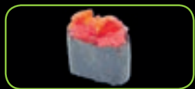
19. Maguro pittige tonijn-tartaar