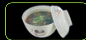
62. Miso shiru miso-soep