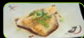
73. Panga teppanyaki gegrilde panga