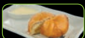
112. Sweet bun zoetbroodje