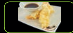
65. Ebi Tempura (2st) Gefrit. garnaal