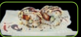
39. Tori tempura krokante kip