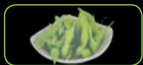
105. Edamame sojabonen