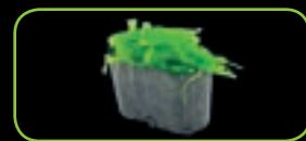
15. Wakame zeewier