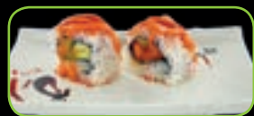
31. Spicy salmon pittige zalm