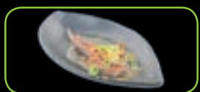
96. Ramuyaki lamsrack