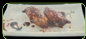
77. Teba saki (2st) kippenvleugels