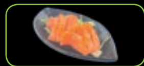
114. Salmom sashimi (6st) € 5,50