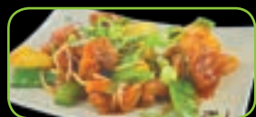
80. Chicken sweet sour zoetzure kip