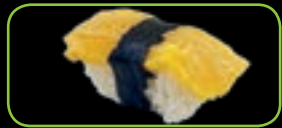
8. Tamago omelet