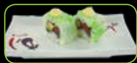
28. Wasabi Sake avocado zalm