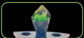
45. Wakame zeewier