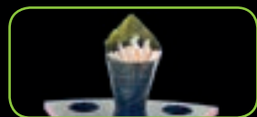
44. California kani krabstick | crab stick