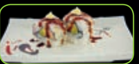
30. Tuna mousse avocado tonijnmousse avocado