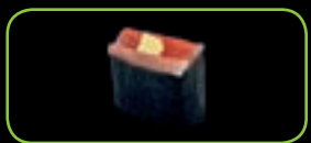
17. Kani krab