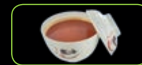
61. Tomato soup tomatensoep