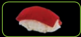
2. Maguro tonijn | tuna