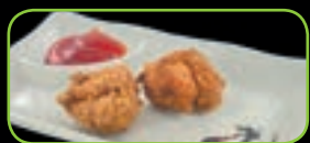
84. Japanese chicken nugget japanse kipnugget