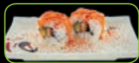
40. Spicy chicken pittige kip