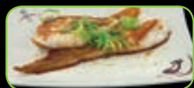
74. Sole teppanyaki gegrilde tongfilet