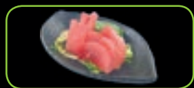
115. Tuna sashimi (6st) € 5,50