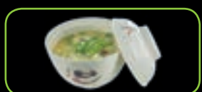
108. Vegetables ramen soup groenten ramensoep