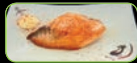
72. Sake teppanyaki gegrilde zalm