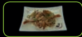
69. Ebi teppanyaki gegrilde garnaal