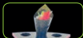
47. Maguro tonijn