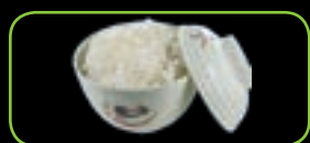
109. Hakumai witte rijst