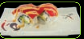
36. Tuna cheese roll tonijn met roomkaas