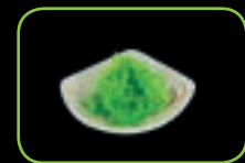
53. Wakame zeewier