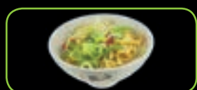
107. Yaki ramen gebakken ramen