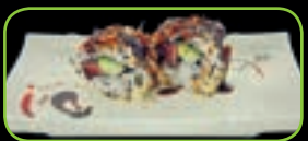
41. Beef roll bief roll