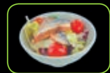
57. Unagi paling