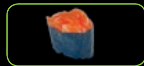
18. Sake pittige zalm-tartaar