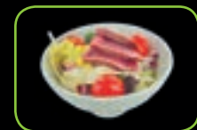
60. Gyu sarada bief-salade