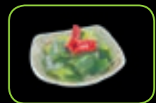
58. Kyuri zuke zoetzure komkommer