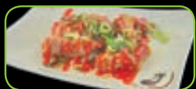
81. Sriracha chicken kip hete chili saus