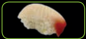
3. Suzuki zeebaars | sea bass