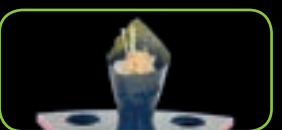
49. Tuna mousse tonijnmousse