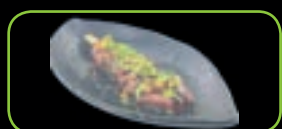
86. Gyu kushi biefspies