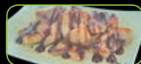
93. Bacon speklap