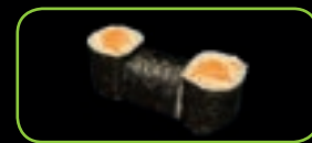
21. Sake zalm