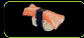
7. Kani krabstick | crab stick