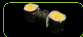
26. Tamago omelet