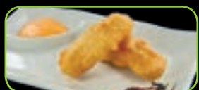
75. Sakana furai japanse gebakken vis