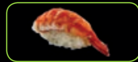
4. Ebi gekookte garnaal | sea prawn