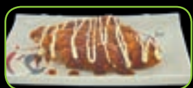
78. Tori no kanage gefrituurde kip