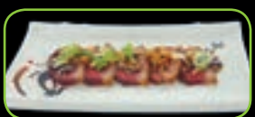
97. Ahirue yaki eendenborst (koud gerecht)