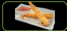
66. Torpedo tempura (2st) torpedo garnaal