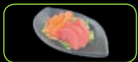
116. Salmon en tuna mix (6st) € 5,50