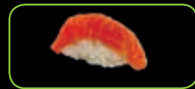
1. Sake zalm | salmon