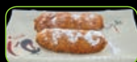
110. Banana katsu (2st) gebakken banaan