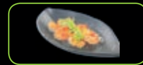
68. Ebi chili pikante garnalen