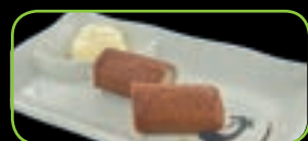
94. Mini frikandel (2st)