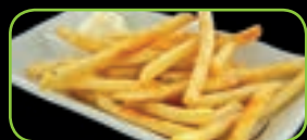
102. Furaidopoteto frietjes