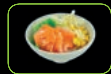
50. Sake zalm