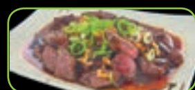
88. Black pepper beef biefstuk zwarte pepersaus