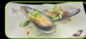
71. Mussels mosselen