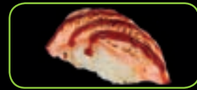
10. Flamed Salmon geflambeerde zalm