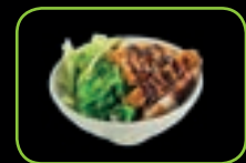
51. Tori tempura krokante kip