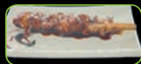
76. Yakitori kipspies