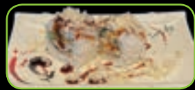
34. Crispy chicken roll