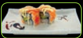
29. California crab avocado krab