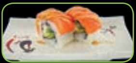
35. Salmon cheese roll zalm met roomkaas