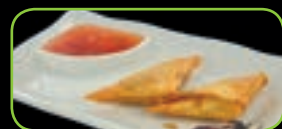
101. Samosa (2st)