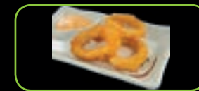
64. Ika tempura (2st) gfr. Inktvisringen