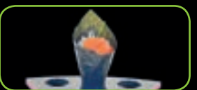
46. Sake zalm