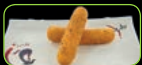
103. Mozzarella sticks (2st)