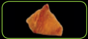
9. Inari tofuzakje