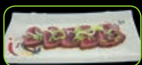
90. Beef tataki koud gerecht