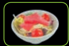
55. Maguro tonijn