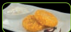
99. Dragon cake (2st) aardappelkoekjes