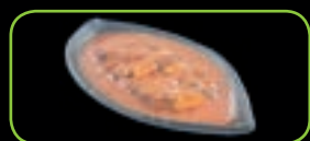
95. Babi pangang vlees met pikante saus