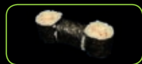
24. Kani krabstick