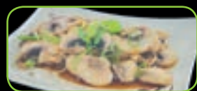
104. Yaki kinoko gebakken champignons