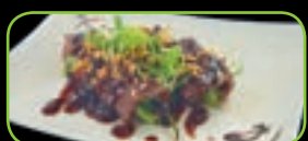
87. Usuyaki biefrol teriyaki