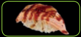
12. Flamed salmon cheese geflam. zalm met kaas