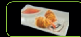
67. Ebi korokke (2st) garnalen krokot