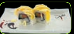
42. Mango salmon mango zalm