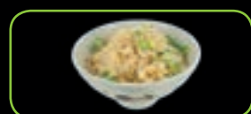
106. Yaki meshi gebakken rijst