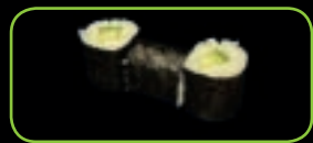
23. Kappa komkommer