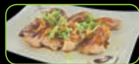
82. Tori Teriyaki kip teriyaki