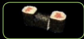
22. Maguro tonijn