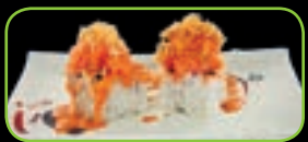
43. Hot salmon pittige zalm-tartaar