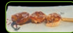
70. Ebi kushi arnalen spies