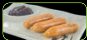
83. Chicken chipolata (2st) kip chipolata worstjes