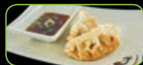
79. Gyoza (2st) kip pasteitjes