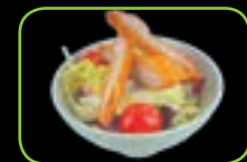
59. Tori sarada gefrituurde kip