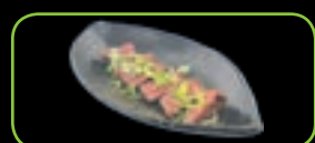
91. Tenderloin teppanyaki gegrilde ossenhaas