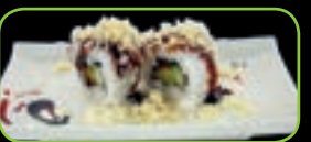
33. Crispy roll