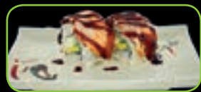
37. Eel cheese roll paling met roomkaas