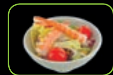
56. Ebi garnaal