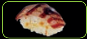
11. Flamed maguro geflambeerde tonijn