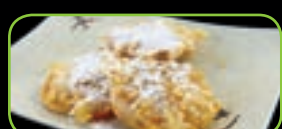
113. Satsumaimo tempura gefr. zoete aardappel