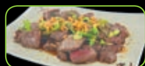
85. Gyuniku teriyaki bief teriyaki