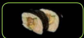
27. Youkoso big roll