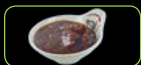
89. Slow cooked beef gestoofd rundvlees