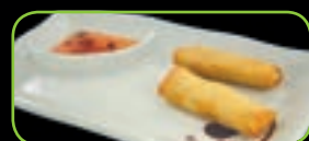
98. Harumaki (2st) mini loempia