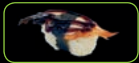
5. Unagi paling | eel