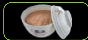
63. Peanut sauce pindasaus