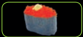
20. Tobiko viskuit