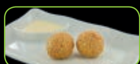
111. Gomaboru (2st) sesamballetjes