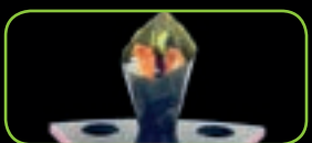
48. Unagi Paling