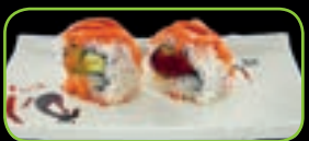
32. Spicy tuna pittige tonijn