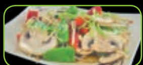
100. Yaki yasai gebakken groenten