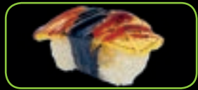
14. Flamed tamago geflambeerde omelet