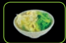
52. Wakame zeewier