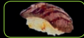
13. Flamed beef geflambeerde bief