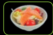
54. Sake zalm