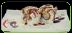
38. Ebi tempura gefrituurde garnaal